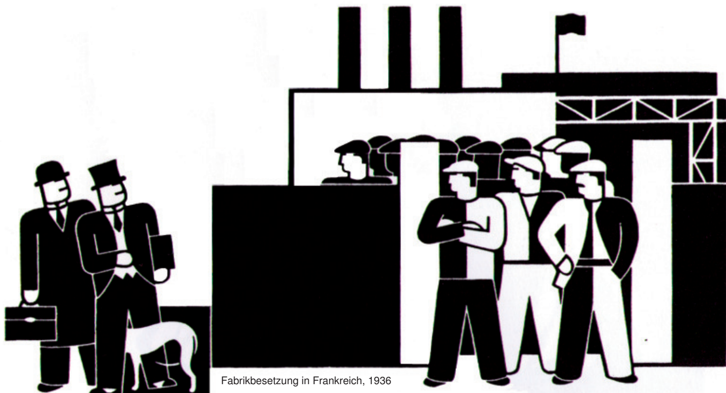
Fabrikbesetzung in Frankreich, 1936