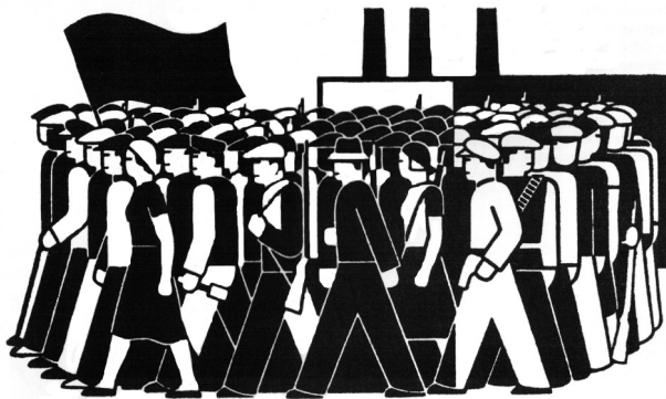
Marschierende Arbeiter, 1934

Samstag, 12.04.2008, 19.30 Uhr, Planwirtschaft